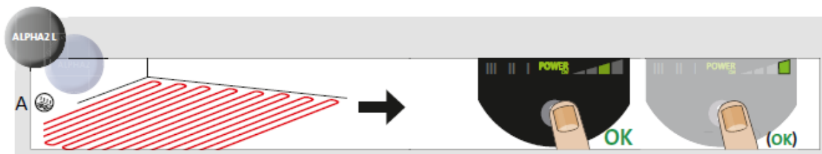
Afb. 3 Keuze van pomp instelling voor systeemtype